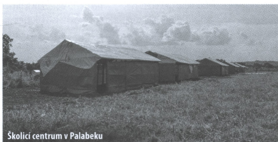
Školící centrum v Palabeku