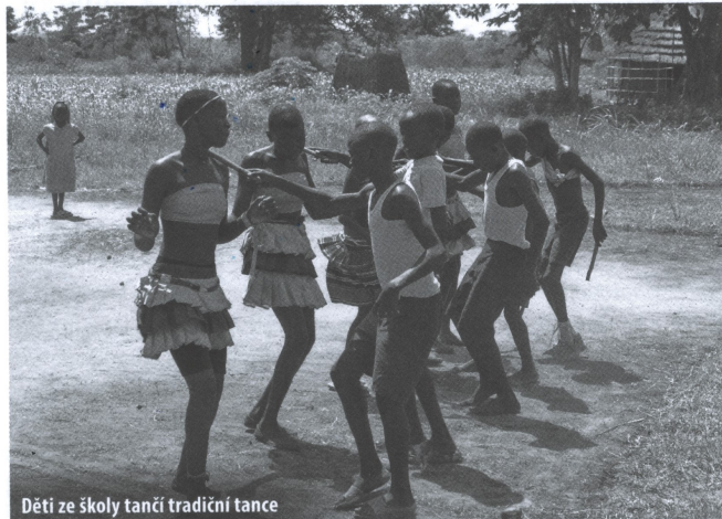
Děti ze školy tančí tradiční tance

3. Setkat se s některými z podporovaných sirotků a přivést jejich dárcům zprávu o tom, jak se dětem daří a jak jsou dary využívány.