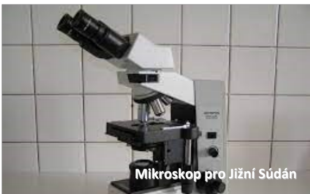
Mikroskop pro Jižní Súdán

Zvážíme-li poměr investovaných nákladů a kvality a kvantity poskytované péče, je naše práce až neuvěřitelně efektivní. Kvalita péče je velmi dobrá, na africké poměry nadstandardní. Vidíme za tím nepochybnou „Boží ruku“. Jsou-li vaše zdroje omezené a přesto chcete mít podíl na záchraně lidských životů, pak je podpora našich zdravotních středisek v Jižním Súdánu tou nejlepší volbou.