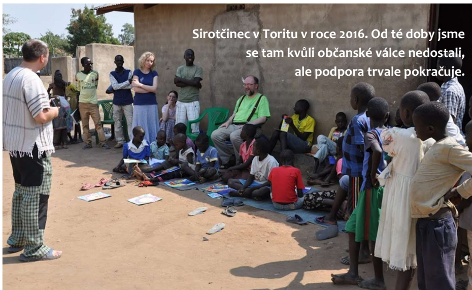
Sirotčinec v Toritu v roce 2016. Od té doby jsme se tam kvůli občanské válce nedostali, ale podpora trvale pokračuje.